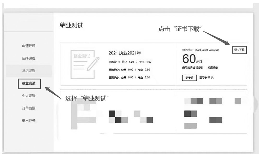
(学习证明下载界面)